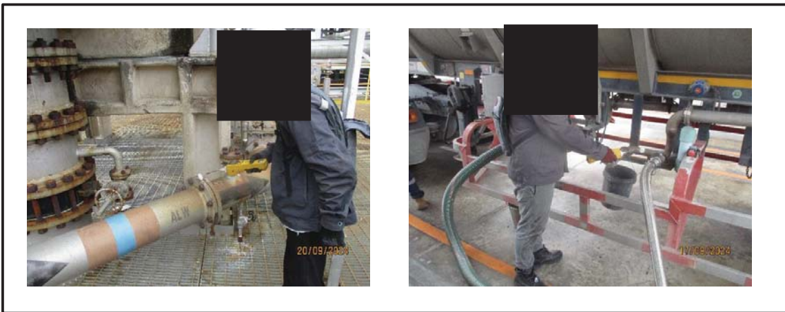
รูปที่ 1 ตัวอย่างอุปกรณ์และการตรวจวัดการรั่วซึมจากอุปกรณ์ในโรงงานที่เป็นแหล่งกำเนิดชนิดฟุ้งกระจาย